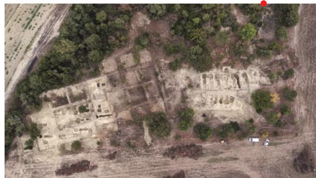
Aléria (Haute-Corse), vue des tombes à chambre de la nécropole de Casabianda, plan-photo drone, P. Valéry – crédits MC/Drac Corse 2017.

Federica Sacchetti , DRAC Paca – service régional de l'archéologie