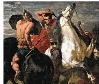
Combat de Romains et de Gaulois, Évariste-Vital Luminais (1821-1896), Musée de Carcassonne.

Il en est ressorti une image complexe de ce millénaire d'histoire de la France avant qu'elle ne devienne la France. Notre vision des Gaulois en a été radicalement changée, de même que notre compréhension de la conquête romaine et des contacts qui l'ont précédée. Les populations celtes du territoire français avaient auparavant eu d'étroits échanges avec les Grecs et les Étrusques. Les déplacements de population eurasiatiques, qui commencent au III e siècle de notre ère et le passage du polythéisme au monothéisme ont contribué au destin hexagonal.