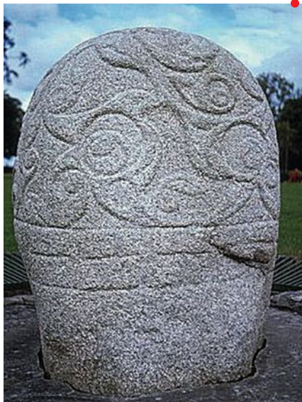
Pierre de Turoe, I er siècle av. J.-C. / I er siècle ap. J.-C. (?).

Conférence en partenariat avec le Site archéologique Lattara – musée Henri Prades