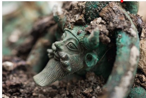
Tombe de Lavau.

Si les Grecs de Phocée sont à l'origine de la fondation de villes portuaires comme Marseille et Empuries, et s'ils ont entretenu des relations étroites avec les populations du Midi méditerranéen, leur influence s'étend bien au-delà des zones littorales. Par les vallées du Rhône et de la Saône vers les bassins de la Seine et du Danube, et par celles de l'Hérault ou de l'Aude vers le Massif Central et la côte atlantique, ils sont entrés en contact avec les populations gauloises à la recherche de biens nécessaires à leur économie : métaux, céréales, esclaves... En échange, ils ont diffusé des produits manufacturés (vases en bronze et poterie de luxe, bijoux, vin...) mais aussi des savoir-faire, notamment dans le domaine architectural.